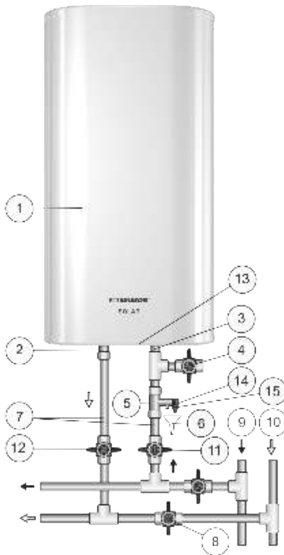
Рисунок 1. Схема подключения ЭВН к водопроводу сверху и снизу

Рисунок 1: 1 – ЭВН, 2 – патрубок горячей воды, 3 – патрубок холодной воды, 4 – сливной вентиль, 5 – предохранительный клапан, 6 – дренаж в канализацию, 7 – подводка, 8 – перекрыть вентиль при эксплуатации ЭВН, 9 – магистраль холодной воды, 10 – магистраль горячей воды, 11 – запорный вентиль холодной воды, 12 – запорный вентиль горячей воды, 13 – нижняя крышка ЭВН, 14 – выпускная труба предохранительного клапана, 15 – ручка для открывания предохранительного клапана.