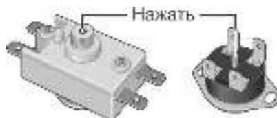
Рисунок 2. Возможные схемы расположения кнопки термовыключателя

Вышеперечисленные неисправности не являются дефектами ЭВН и устраняются потребителем самостоятельно или за его счет.