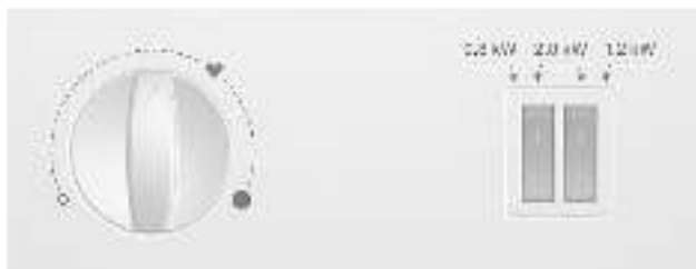
Рисунок 2. Панель управления водонагревателя

(стандартный), оба переключателя зажать одновременно – 2000 Вт (ускоренный). Чтобы выключить водонагреватель, необходимо перевести регулятор в положение «0».